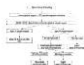
Figure 3 Proposed algorithm for the management...